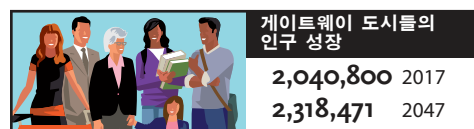
출처: 2012 SCAG RTP DATA 에 기초한 메트로의 계산